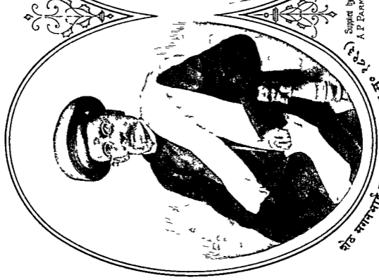
(१९७२) ०३ एम. ए. ए. शेठ मंगलभाई कपुरचंद-पुना